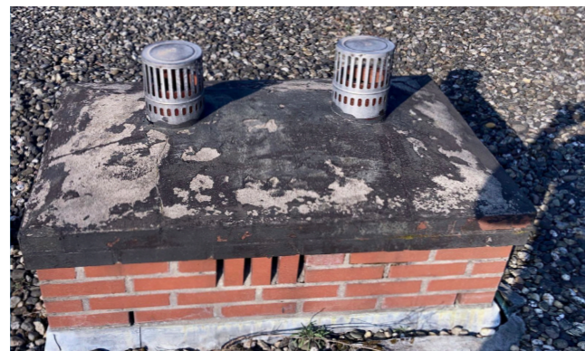
DE OUDE SCHOORSTENEN